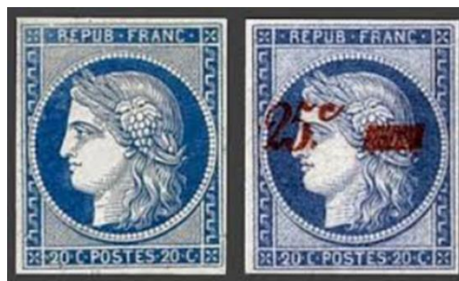
Ill. 9: Ikke udgivne mærker

Der er yderligere to udgaver, som er blevet fremstillet, men ikke sat i omløb.