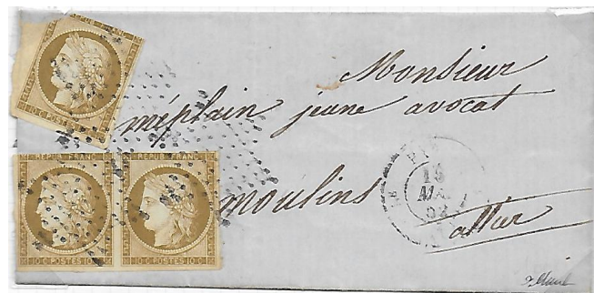
Ill. 15: Brev fra Paris til frankeret med 3*10 Centimes til Moulins-sur-Allier 16.5.1853. Takst 25 Centimes, derfor overfrankeret med 5 Centimes