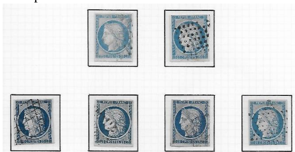
Ill. 7: Farvevariationer 25 Centimes

Alle værdierne er uden vandmærker og har tydelige farvevariationer: Sort til grå. Mørkeblå til lyseblå, lys orange til rødorange, gulgrøn til mørk grøn m.m. Ligeledes er der anvendt forskelligt farvet eller tonet papir. 25 Centimes som eksempel: