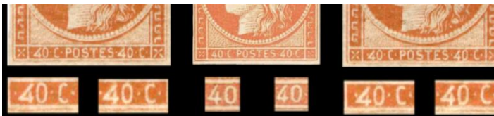
Ill.6: Retouche 40