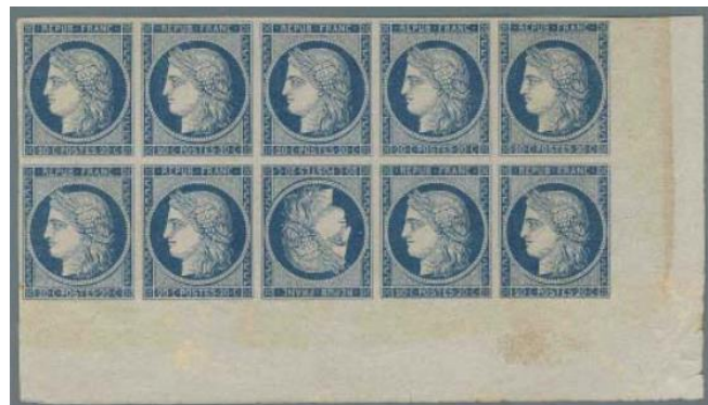
Ill. 14: Pos. 148

Det ikke udgivne 20 Centimes blå indeholdt 3 tête-bêche klichéer der var placeret i pos. 92, 110 og 148. Dette betyder, at der blev trykt ca.100.000 tête-bêche par, men da stort set hele oplaget blev destrueret i juli 1850 er der ganske få der har overlevet.