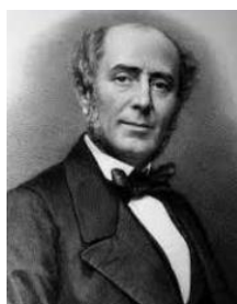
Ill. 2 Etienne Arago

I 1839 fremkom en række parlamentsmedlemmer med forslag om en reform af postvæsenet, i lighed med hvad man havde gennemført i England. I den periode eksisterende der et uoverskueligt antal takster og takstzoner, hvilket var til stort besvær for både private og næringsliv. Finansministeren blokerede dog for alle forslag, indtil det lykkedes postdirektøren, Etienne Arago – der også var med til at grundlægge Le Figaro,