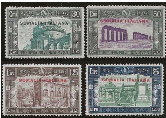
Ill. 5 - Udgave for Somalia. Udkom 20. oktober 1930

Udkom i farverne 30+10 c sortgrøn/grønblå, 50+10 c sortgrøn/violet, 1,25 l+30 c mørkebrun/brun og 5+1,50 l mørkeblå/dunkelgrøn. Serien udkom samtidig i samme værdier og farver for Eritrea, Cirenaica og Tripolitania.