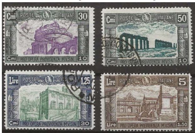
Ill. 4 - Udkom i farverne 30+10 c sortgrøn/violet, 50+10 c sortgrøn/grønblå, 1,25 l+30 c mørkeblå/dunkelgrøn og 5+1,50 l mørkebrun/brun.

Mange af udgivelserne er ens i kolonierne. Der er 32 serier med ens særfrimærker eller udgivet i samme anledning i 2 eller flere