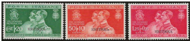
Ill. 3 - Udgave for Eritrea. Udkom 17. marts 1930. Udkom i farverne 20 c grøn, 50 + 10 c orangerød og 1,25 l + 25 c karmin.

Serien udkom samtidig i samme værdier og farver i Cirenaica, Tripolitania og Italiensk Somalia.