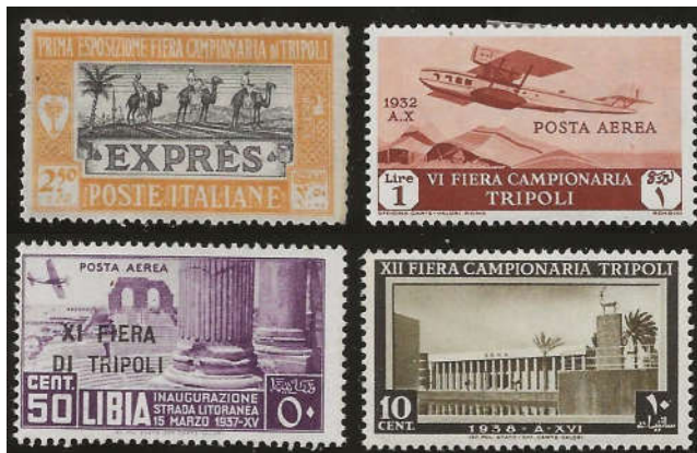
Ill. 21 - Handelsmesse i Tripoli 1927, 1932, 1937 (Libyen) og 1938.