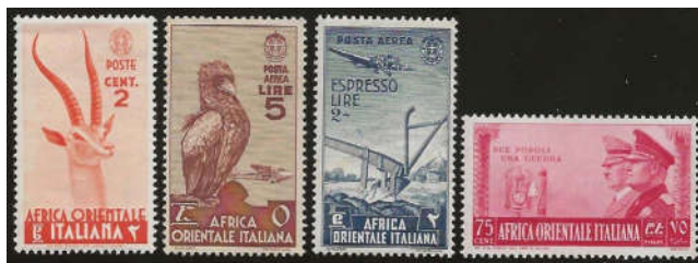
Ill. 16 - Værdier fra 1. serie. Almindeligt frimærke, luftpost og ekspresmærke samt motiv fra tysk-italiensk våbenbroderskab

Alle udgaver for området har vandmærke 1. Der er ingen sammenfaldende motiver med Italien. I 1941 udkom 13 portomærker. Portomærkerne er overtryk A.O.I på italienske portomærker.