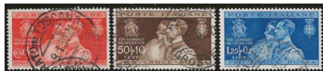
Ill. 2 - Udgave fra Italien. Udkom 7. januar 1930. Udkom i farverne 20 c orangerød, 50 + 10 c mørkebrun og 1,25 l + 25 c blå.