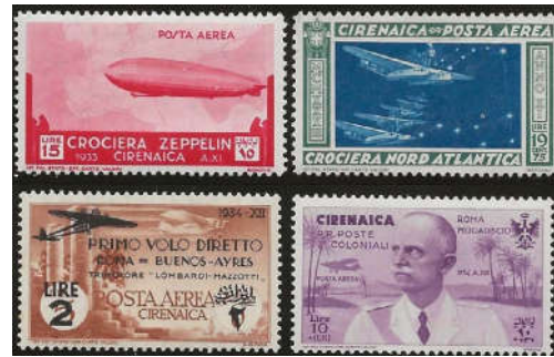
Ill. 20 - 1933 Graf Zeppelin i Italien, flyvning Rom-Chicago, flyvning Rom-Buenos Aires og kongens besøg i Italiensk Somalia 1934

Der blev udgivet særfrimærker for Cirenaica 1923 til 1934. Cirenaica omfattede den østlige del af det nuværende Libyen med hovedbyen Bengasi. Det startede med overtryk CIRENAICA på italienske frimærker, et par fællesserier for kolonierne, italienske udgaver i ændrede farver med betegnelsen CIRENAICA for at slutte med nogle egne, primært luftpost udgaver. Sidste udgave udkom i december 1934 i anledning af postflyruten Rom-Tobruk-Masaua-Mogadischu og Kong Vittorio Emanuele III's besøg. I tilslutning til udgaven udkom et tjenestemærke. Det eneste tjenestemærke for området.