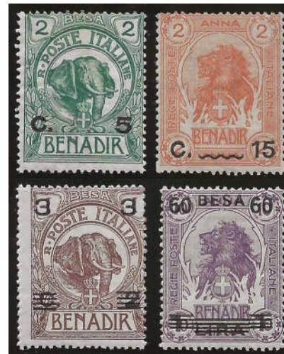
Ill. 11 - 2 værdier fra 1906 overtryk og 2 værdier fra 1923 overtryk

I årene 1921 til 1925 udkom der flere serier med overtryk SOMALIA ITALIANA og besa værdier på italienske frimærker.