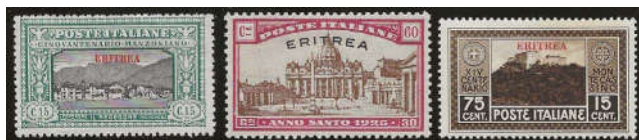
Ill. 8 - Italiensk frimærke fra Manzoni og Det hellige År 1925 serien samt Monte Casino klostersonen i anden farve.

I 1910/14 udkom de første endelige udgaver med motiver fra området. Betegnelsen var Colonia Eritrea samt Regno d'Italia. Udgivelse af særfrimærker indtil 1931 var primært italienske