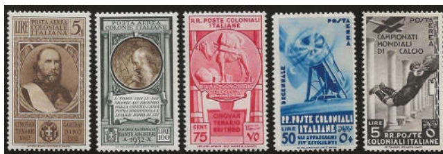
Ill. 14 - Værdier fra serierne med Garibaldi, Dante selskabet, kolonien Eritrea 50 år, 10 året for marchen mod Rom og VM i fodbold 1934.

Både egne og italienske frimærker er forsynet med vandmærke 1 fra Italien.