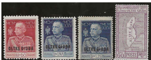
Ill. 13 - Daglig frimærker udgivet i anledning af Kong Vittorio Emanuele III 25-års regeringsjubileum er udgivet i samtlige frimærkeområder i 1925 (Cirenaica, Eritrea, Oltre Giuba, Italiensk Somalia og Tripolitania).

De første frimærker udkom 29. juni 1925. På et år udkom 43 frimærker inklusive ekspresmærker, 13 pakkeporto mærker, 6 postanvisningsmærker og 10 portomærker.