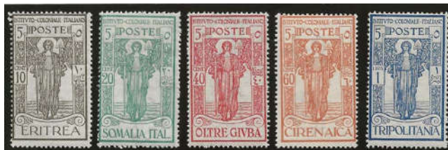
Ill. 6 - Italienske koloniinstitutter fra 1926 (Eritrea, Cirenaica, Tripolitania, Italiensk Somalia og Oltre Giuba). En af få der ikke er overtrykt på italienske frimærker eller italienske frimærker i ændret farve.

af kolonierne. Antal kolonier afhænger bl.a. af hvor mange frimærkeområder der eksisterede på udgivelsestidspunktet.