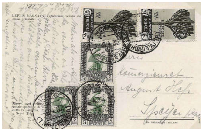
Ill. 22 - Postkort til Tyskland fra april 1932 med frimærker fra Libyen og Tripolitania

Der udkom 1 gebyrmærke og en serie med postanvisningsmærker. Som altid overtryk på italienske mærker. Udgivelser fra Libia blev benyttet til pakkeporto og portomærker.